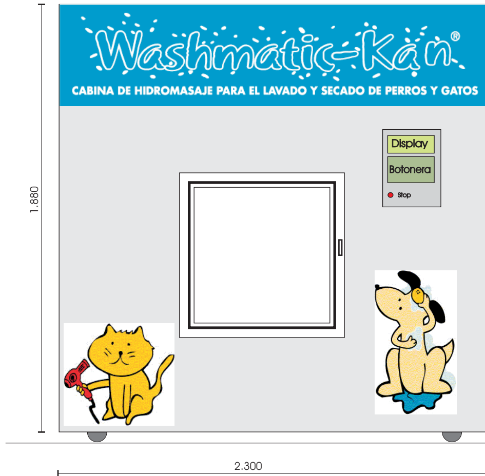
VISTA FRONTAL FRONT VIEW